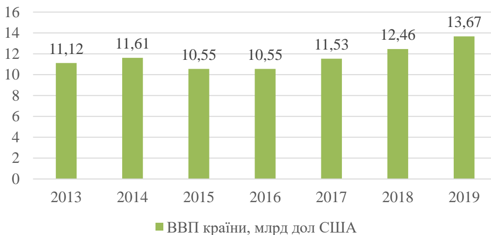
Рис. 1. Динаміка ВВП Вірменії у 2012-2019 рр., млрд дол. США