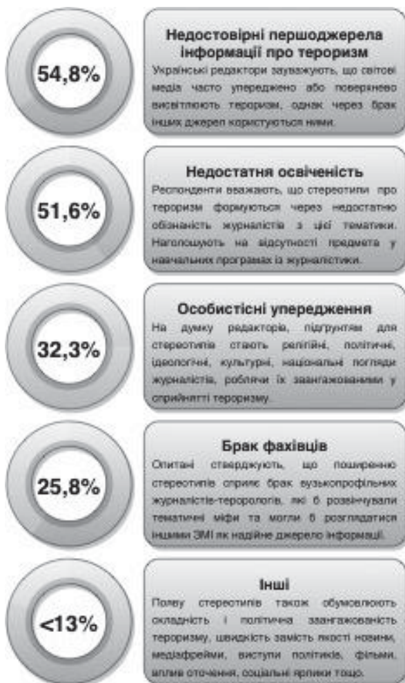
Рис. 1. Частота згадувань детермінант українськими міжнародними редакторами

Загалом усі описані у статті детермінанти стереотипізації феномену тероризму у журналістському середовищі можна умовно поділити на чотири типи (див. рис. 2):