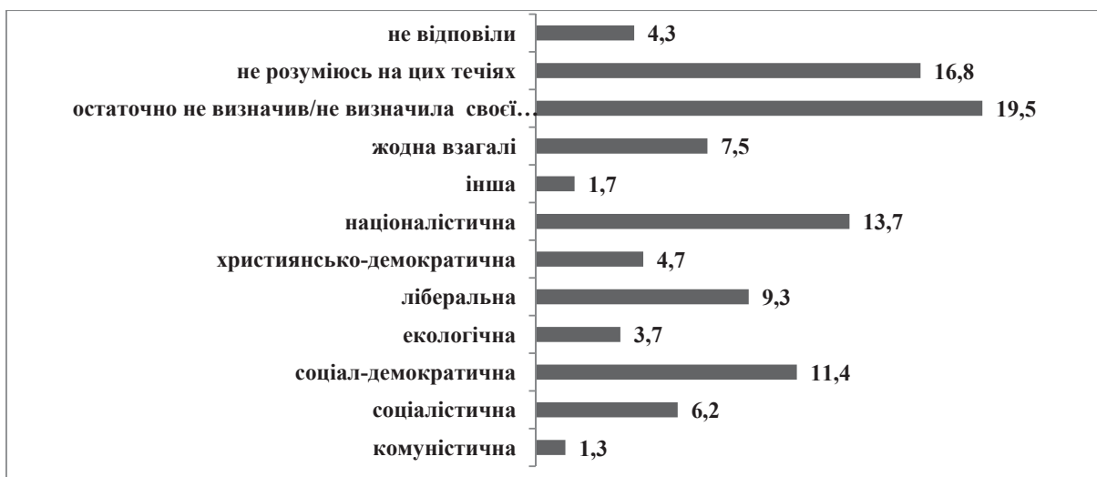
Рис. 2. Розподіл відповідей на запитання «У політичному спектрі зазвичай вирізняють окремі більш-менш самостійні течії. Нижче наведено декілька таких течій.

Оцінюючи суспільно-політичні преференції випускників загальноосвітніх навчальних закладів обласного центру Прикарпаття в контексті даних по Україні загалом 1 [24], розуміємо, що прикарпатські школярі значно більше орієнтовані підтримувати націоналістичні ідеї.