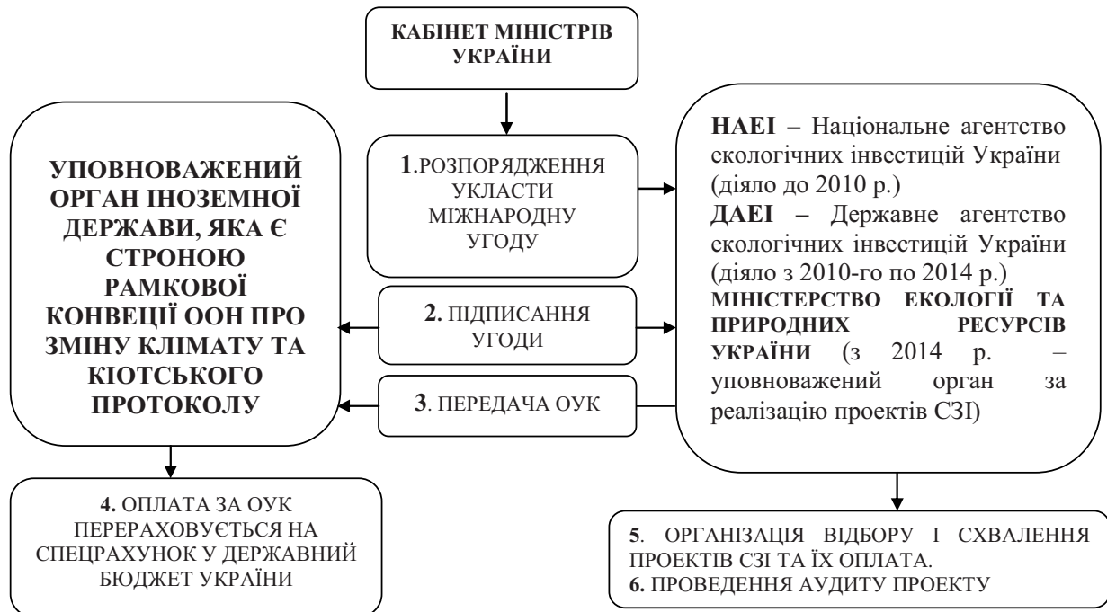
Рис. 1. Процес реалізації проектів цільових екологічних (зелених) інвестицій за СЗІ України

виконання зобов'язань сторін Кіотського протоколу до Рамкової Конвенції ООН про зміну клімату» (далі – Постанова № 221). Постанова № 221 закріпила умови взаємодії центральних органів виконавчої влади і заявників проектів цільових екологічних інвестицій з питань відбору та реалізації проектів цільових екологічних (зелених) інвестицій (далі – проекти) 1 . Схематично процес реалізації проектів СЗІ відображено на рис. 1.