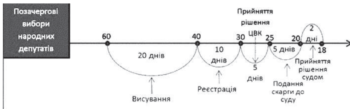
Рис. 2. Строки висування кандидатів у народні депутати України під час позачергових виборів

Правосуб'єктність політичних партій, щодо висування кандидатів у народні депутати України. У відповідності до Закону України «Про вибори народних депутатів України» суб'єктами висування кандидатів у народні депутати України є політичні партії, що утворені та зареєстровані у встановленому законом порядку. Інших вимог закон не визначає. У попередніх редакція виборчого законодавства мали місце положення, що визначали граничні строки утворення політичних партій. Зокрема, допускалися до участі у виборчому процесі політичні партії, що були утворені та зареєстровані не пізніше одного року до дня проведення голосування. Професор О.В. Марцеляк також схвально відноситься до таких характеристик виборчої правосуб'єктності політичних партій. Автор стверджує, що така практика є допустимою для багатьох демократичних країн 1 . Такими вимогами законодавець створював додаткові «правові фільтри» для політичних партій, що не мають наміру приймати участь у виборчому процесі як повноцінний суб'єкт «політичної боротьби», а планують приймати участь як «технічні партії» (ведення антиагітації, «отримання представників» у складі окружних та дільничних виборчих комісіях, «відтягування» голосів конкурентів тощо).